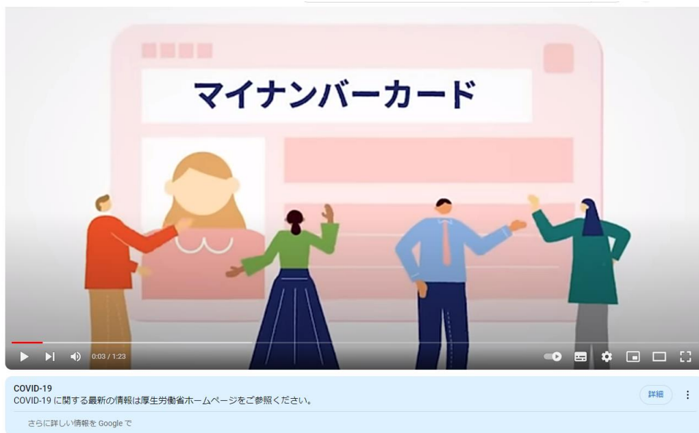
マイナンバーカード「いま」と「これから」

マイナンバー 制度「報告」と「対策」 (youtube.com) https://www.youtube.com/watch?v=cPGselfiWxc